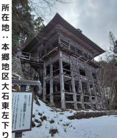
所在地…本郷地区大石東左下り

第二駐車場から歩いて登り五く六分で着きます。四季の景色を感じながら登っていくのも楽しいかなと思います。ご本尊は聖観音様です。