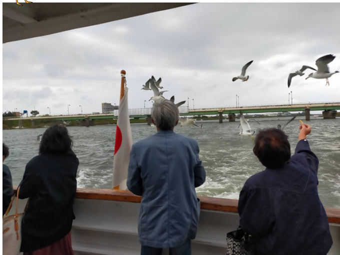
信濃川ウォーターシャトル乗船