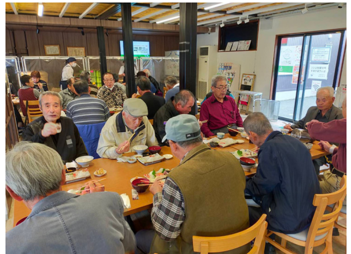
みなとマルシェで新鮮な海鮮ランチ