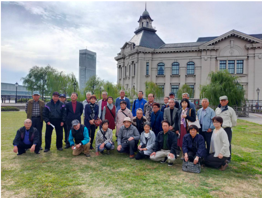
新潟市歴史博物館みなとぴあにて

コロナ禍で開催できなかった「互助会旅行（新潟ふるさと村方面）」を4年ぶりに開催、30名の方が参加され楽しく交流を深めた旅となりました。