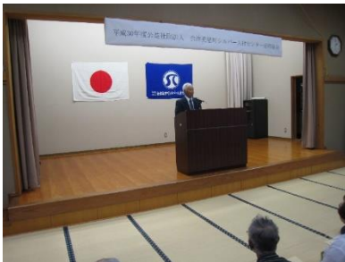
長谷川副理事長より開会のあいさつ