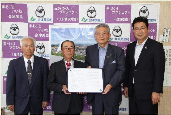
写真は会津美里町長と協定書を締結した様子です