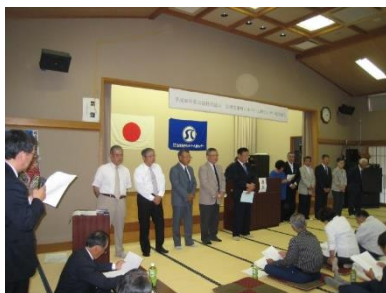
新理事・新監事 紹介のようす