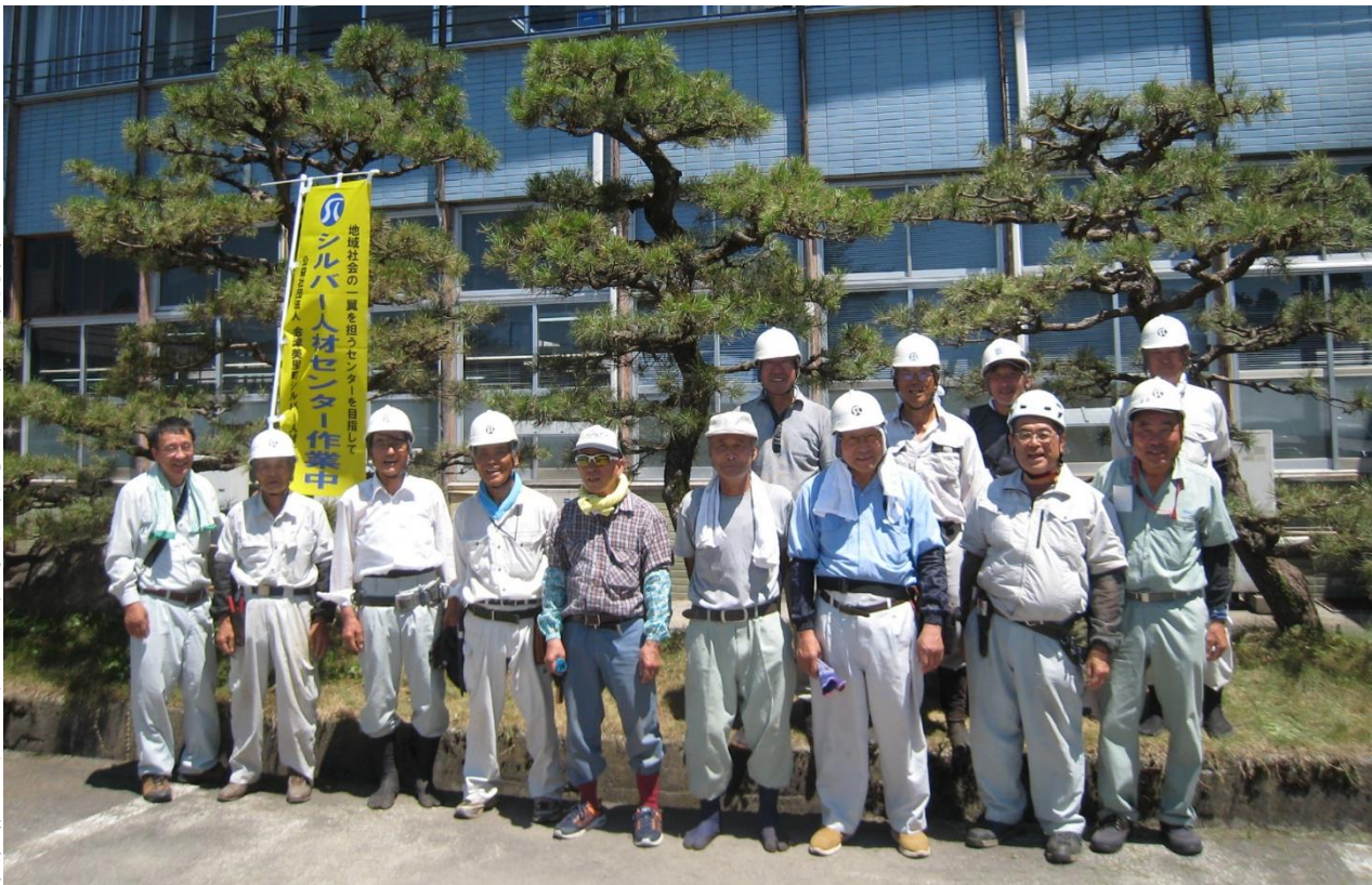
技能講習会 松の手入れ（八月三日 高田庁舎）