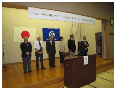
旧役員の皆様お世話になりました